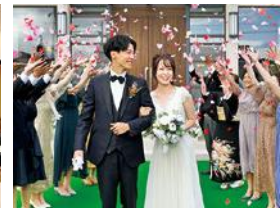
8. チャペルガーデン