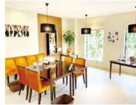
3. ブライダルサロン